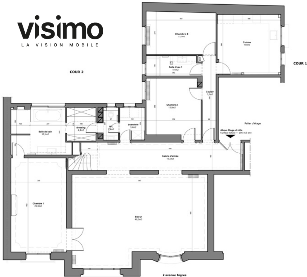
Niveau bas - 4ème étage