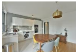
SAM ET CUISINE