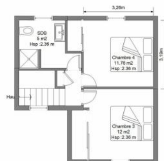
R+2 - Surface Env 32 m² - Hauteur sous plafond 2.36 m Ce plan est la propriété exclusive de la Société VISIMO.FR, toute reproduction, même partielle est formellement interdite sous peine de poursuites. Toutes les données sont à titres d'informations et ne peuvent engager la responsabilité de la société VISIMO.FR