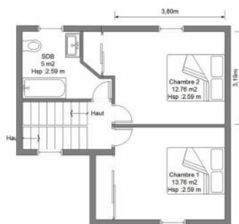
R+1 - Surface Env 32 m² - Hauteur sous plafond 2.59 m Ce plan est la propriété exclusive de la Société VISIMO.FR, toute reproduction, même partielle est formellement interdite sous peine de poursuites. Toutes les données sont à titres d'informations et ne peuvent engager la responsabilité de la société VISIMO.FR